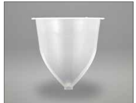
足つきで自立する形状のストレーナー