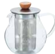
ティーピッチャー TPC-45HSV

C/T24 093928 幅 140・奥 105・高 123 口径 67 実用容量 450mL