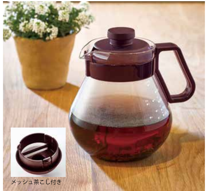
メッシュ茶こし付き

材質：本体 / 耐熱ガラス フタ・茶こし・取っ手バンド・ホルダー / ポリプロピレン メッシュ / ポリエステル