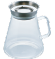
ティーサーバー Simply TS-70-HSV

材質：本体 / 耐熱ガラス 注ぎ口・フィルター・注ぎ口プレート / ステンレス フィルターパッキン・注ぎ口パッキン / シリコンゴム