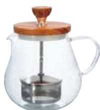
ティオール・ウッド TEO-70-OV

材質：本体 / 耐熱ガラス フタ・ツマミ / オリーブウッド ツマミ台座・内フタ / ポリプロピレン シャフト・ストレーナー式・ナット / ステンレス パッキン / シリコンゴム