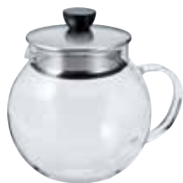
ジャンピングリーフポット S JPS-60-HSV

C/T24 410954 幅 162・奥 122・高 140 口径 82 実用容量 600mL