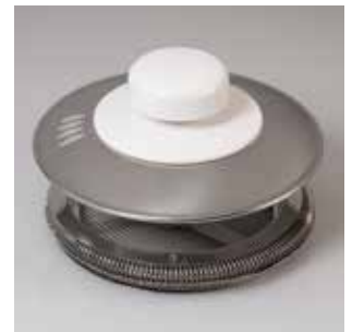
吹きこぼれ対策付きのフタ。

ヒーター本体 / ナイロン 天板 / 耐熱ガラス フタ / ステンレス フタツマミ・ハンドル / メラミン樹脂 バンド / ステンレス AC100V 50/60Hz 700W