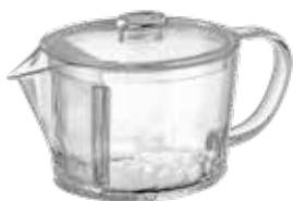
フィルターイン急須 晶 FIK-45-T

HARIO × tritan™ MADE IN JAPAN from eastman