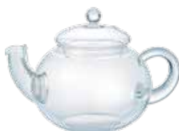
ジャンピングティーポット JP-4-SV

茶こしを外して電子レンジ OK 材質：本体・フタ / 耐熱ガラス 茶こし / ステンレス