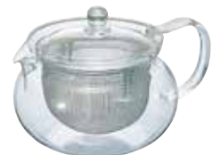
受注単位：1C/T 茶茶急須 丸 CHJMN-70T

C/T24 093119 幅 155・奥 118・高 95 口径 94 実用容量 450mL