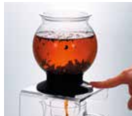
スイッチを押して抽出します。