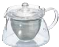
受注単位：1C/T 茶茶急須 角 CHJKN-45T

C/T24 093126 幅 173・奥 132・高 108 口径 107 実用容量 700mL