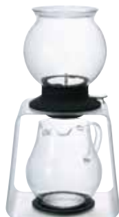
ティードリッパー ラルゴスタンドセット TDR-8006T

材質：本体 / 耐熱ガラス フタ / AS 樹脂 フィルター・ステンレス球 / ステンレス ホルダー / シリコンゴム スイッチ / ポリプロピレン