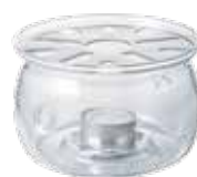
ティーウォーマー S TWJ-S

C/T12 410985 幅 225・奥 137・高 130 口径 79 実用容量 800mL 茶こしを外して電子レンジ OK