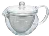
受注単位：1C/T 茶茶急須 丸 CHJMN-30T

C/T24 093102 幅 143・奥 98・高 98 口径 94 実用容量 300mL