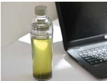
オフィスやリモート時にも