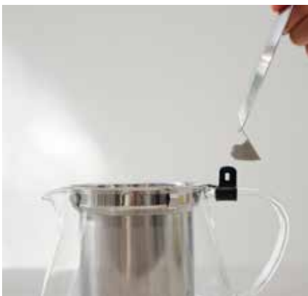
フタは取り外し可能です。