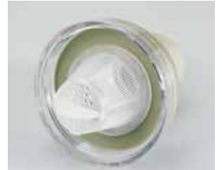
飲み口の内側にフィルターメッシュがセットされています。