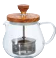
ティオール・ウッド TEO-45-OV

C/T24 154117 幅 150・奥 116・高 138 口径 82 実用容量 450mL