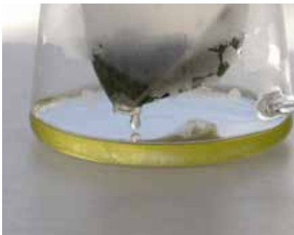
お茶のおいしさを落とす