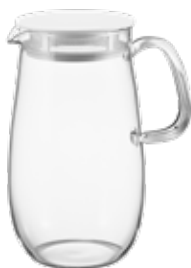
レンジでかんたん麦茶ポット むぎちゃん XMP-1000-W

C/T24 748385 幅 103・奥 150・高 183 実用容量 1,000mL