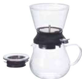
ティードリッパー ラルゴ 35 サーバーセット TDR-5012B

材質：本体 / 耐熱ガラス フタ / AS 樹脂 フィルター・ステンレス球 / ステンレス ホルダー / シリコンゴム スイッチ / ポリプロピレン