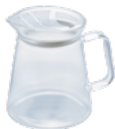
フタなしティーポット・クリア FNC-45-T

C/T24 044814 幅 130・奥 100・高 123 口径 74 実用容量 450mL