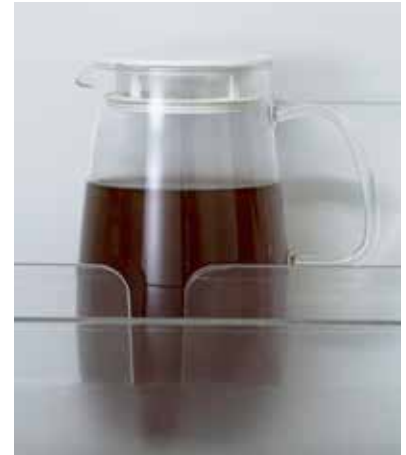
奥行き 11cm 以上の冷蔵庫ドアポケットに収納できます。