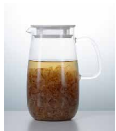
出汁ポットとしても。