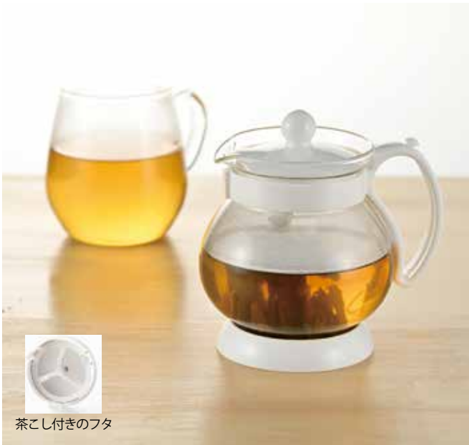
茶こし付きのフタ