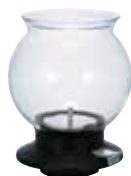
ティードリッパー ラルゴ TDR-80B

C/T12 022300 径 130・高 165 口径 100 実用容量 800mL