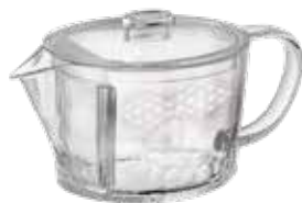
フィルターイン急須 麻の葉 FIK-45-AS

C/T48 038639 幅 184・奥 102・高 96 実用容量 450mL