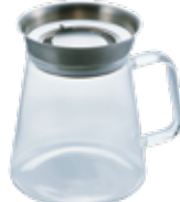
ティーサーバー Simply TS-45-HSV

C/T24 044746 幅 128・奥 100・高 124 口径 74 実用容量 450mL