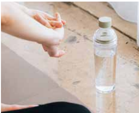
ストレーナーを外してウォーターボトルとして