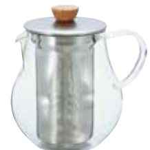
ティーピッチャー TPC-70HSV

材質：本体 / 耐熱ガラス フタ・ストレーナー / ステンレス フタつまみ / 天然木