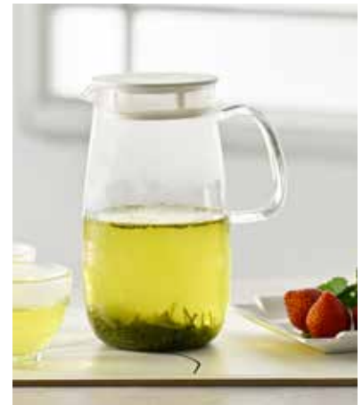
フィルター付きのフタなので茶葉を入れてもお使いいただけます。