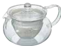
受注単位：1C/T 茶茶急須 丸 CHJMN-45T

C/T24 093119 幅 155・奥 118・高 95 口径 94 実用容量 450mL