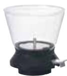
ティードリッパー ラルゴ 35 TDR-35B

C/T12 022331 幅 123・奥 114・高 120 口径 110 実用容量 350mL