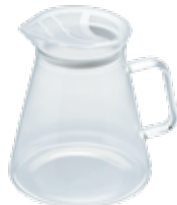
フタなしティーポット・クリア FNC-70-T

材質：本体 / 耐熱ガラス 注ぎ口 / PCT 樹脂 パッキン / シリコンゴム