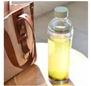
マイボトルとして