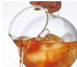
ティードリッパーラルゴスタンドセットには、氷が落ちにくい注ぎ口のアイスティーピッチャーがセットされています。