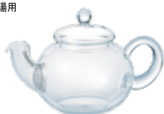
ジャンピングティーポット JP-2-SV

C/T12 410978 幅 195・奥 120・高 125 口径 68 実用容量 500mL