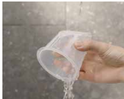
洗やすいストレーナー