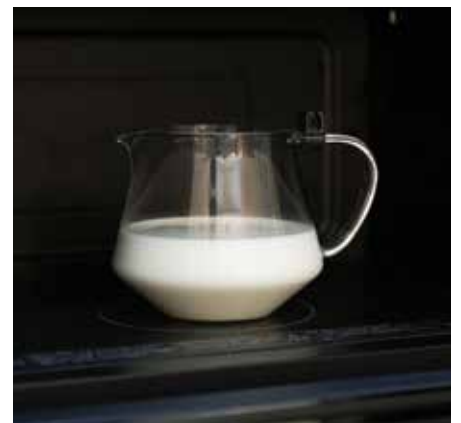
フタ・ストレーナーを外せば電子レンジ OK。