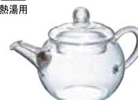
アジアン急須 丸形 QSM-1

C/T24 396920 幅 150・奥 90・高 95 口径 60 実用容量 180mL