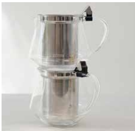
積み重ね収納可能なのでカフェ使用にも。