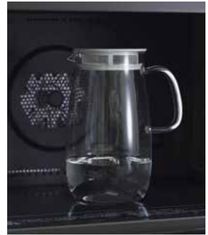
庫内高さ 19cm 以上の電子レンジに対応します。