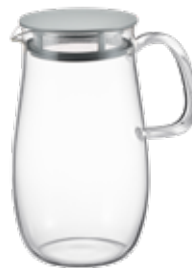
レンジでかんたん麦茶ポット むぎちゃん XMP-1000-DGR 748392

材質：本体：耐熱ガラス フタ・フィルター／ポリプロピレン パッキン／シリコーンゴム